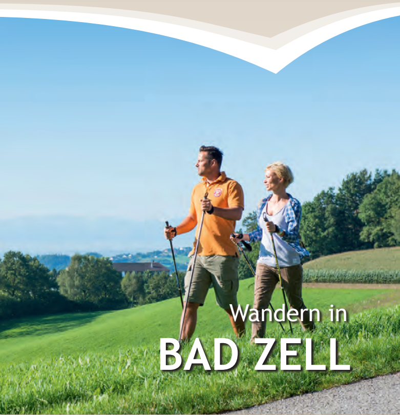
Kurort Bad Zell, Seehöhe 515m